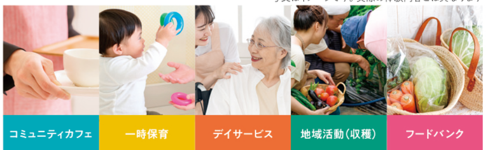
コミュニティカフェ