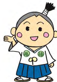
静岡県社会福祉人材センターの イメージキャラクター「ふくしんぼうし」