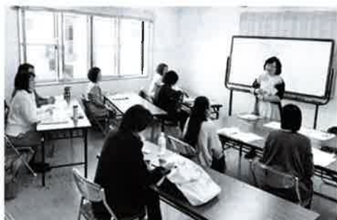
ハーサイズセミナーの様子

また、「自己管理」と「お客様の視点」を忘れずに、ということをお伝えしたいです。「自己管理」とは、自分の時間を知ることから始まります。家事や育児、介護など、ライフサイクルで自分時間を左右されてしまう女性にとって、自分の起業活動にあてられる時間はわずか。やるべきこと、やらなくてもいいことを判断し切り分け、やるべきことは優先順位をつけてやるべき時にやる。ひとり起業だからこそその自己規律と時間管理が必要です。「お客様の視点」とは、自分の強みを客観