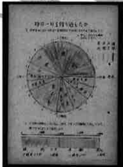
婦人学級教材綴：昨日一日をどう過したか