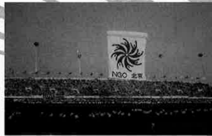
第4回世界女性会議 NGOフォーラム 開会式セレモニー