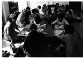
「子育て支援活動の表彰」 厚生労働大臣賞受賞

沖縄のママたちが子育てフリーペーパーを発行 沖縄は国内でも独特の文化を持つ地域で季節感も違います。 フリーペーパー「たいようのえくぼ」は、そんな沖縄で子育てす るうえで知っておきたい情報を、沖縄に住むママたち自身が収 集し紹介しています。沖縄県内でもさらに子育て事情の異なる 離島版の発行を目標に活動しています。