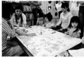
「子育て支援活動の表彰」 文部科学大臣賞受賞