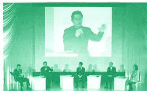
昨年のトークセッションの様子