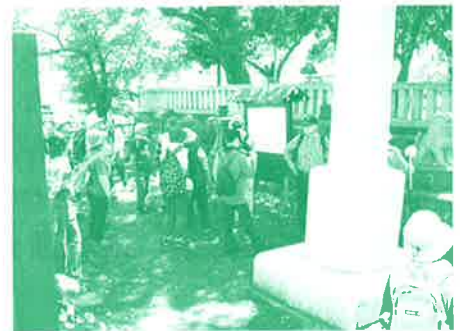
伊豆学研究会文化財ウォーキング