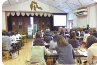
保護者会・総会と同時開催も可