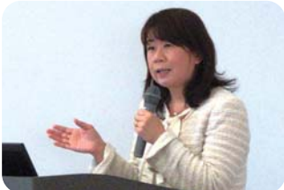
母親目線でのやさしい講義