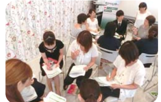
楽しいグループワークもあり