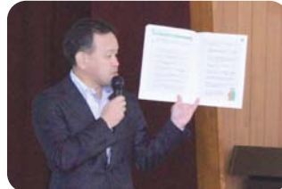
専門家から学ぶセキュリティ対策