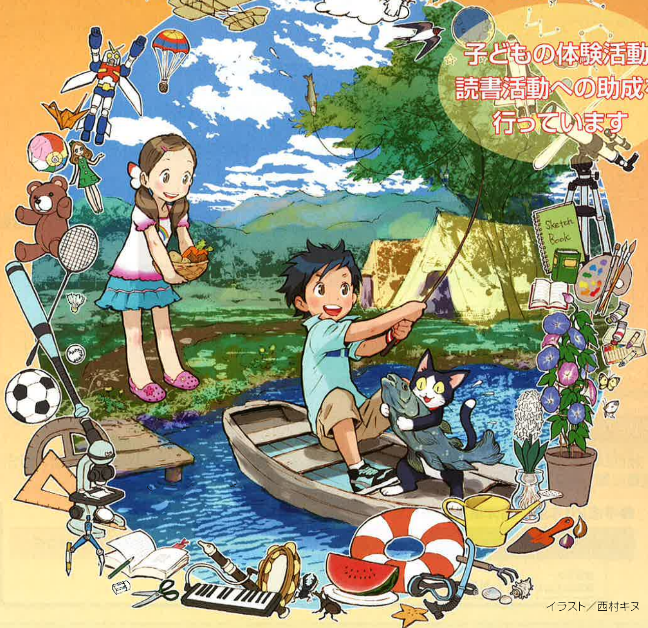
イラスト/西村キヌ

一次募集 郵送 平成26年10月1日(水)～12月 3日(水)消印有効 ※2 電子申請 平成26年10月1日(水)～12月 5日(金)17時 締切 二次募集 ※1 郵送 平成27年 5月1日(金)～ 6月24日(水)消印有効 ※2 電子申請 平成27年 5月1日(金)～ 6月26日(金)17時 締切