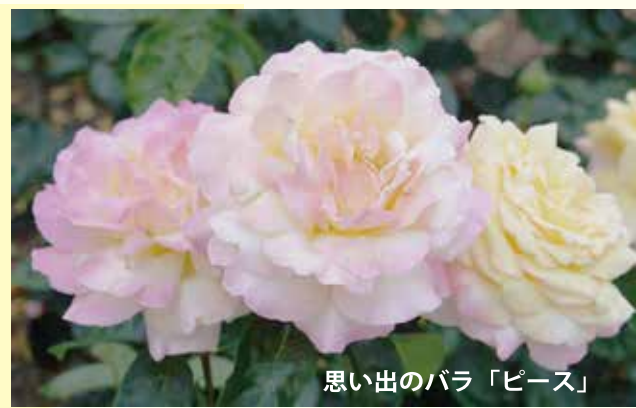
思い出のバラ「ピース」