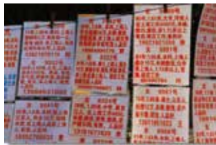
女性のプロフィールが書かれたビラ(写真2)