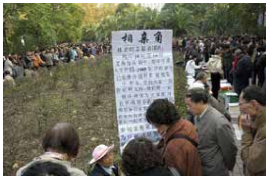
婚活のために人民広場に集まる親世代

毎週日曜日、上海市の中心部にある人民広場に初老の男女が集まって来る。手には息子や娘のプロフィールが書かれたボードやビラを持つ。