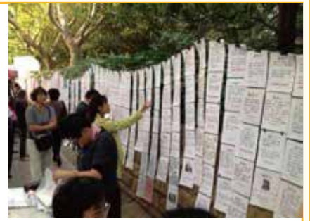
プロフィールを丹念にみる親たち

公園の樹木には、プロフィールの紙がびっしりと吊り下げられている。年頃の子どもの持つ親は、良縁を求め、ビラを丹念に見て回る。