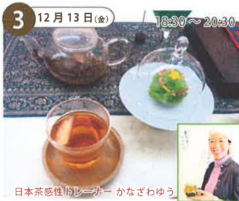
【Let's ベジフル コミュニケーション】