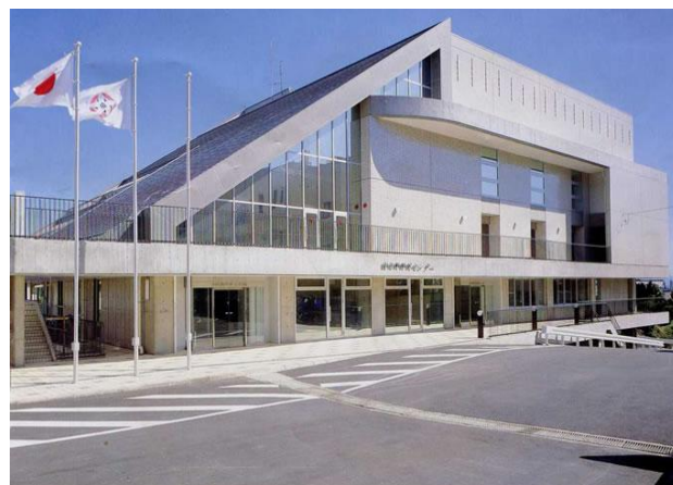
由比生涯学習交流館