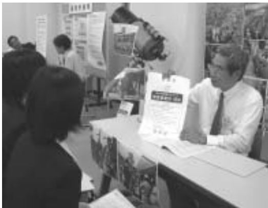
男女共同参画社会づくり宣言事業所の登録証を手に説明する(有)牧野設備社長