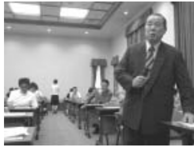
県議会議員から鋭い質問が…