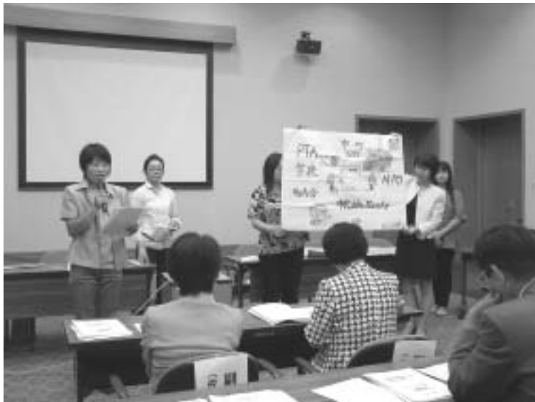
練りに練った政策を提言！ こいイチバンで緊張。