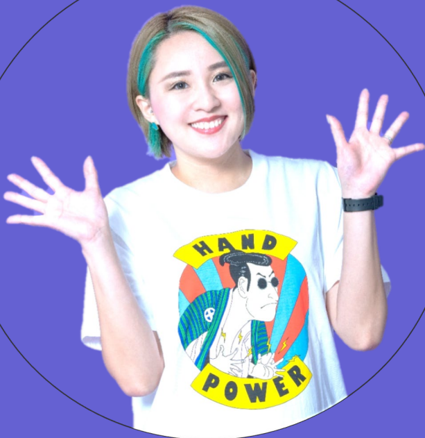
助産師/性教育YouTuber シオリヌ