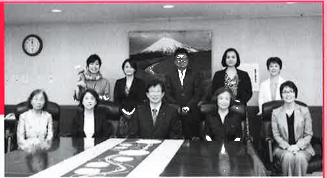
表彰式 / 2016年7月25日(月) 県庁東館特別会議室にて 川勝知事と平成28年度知事褒賞受賞者たち

静岡県では、「男女共同参画推進条例」に基づき、男女共同参画の推進に関する取り組みを積極的に行っている個人・団体を表彰しています。選考委員会による選考の結果、本年度の受賞者が以下の通り決定されました。