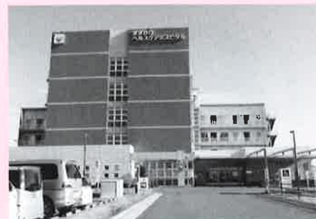
磐田市で、地域のニーズに応える「すずかけヘルスケアホスピタル」

「訓練はきびしいけど、回復が早いからうれしい」「退院してからも面倒見がいい」「職員が親切で明るい」など患者の評判がいいのは、《治療が終わったらおしまい》ではなく、退院後の生活を長く支えていくという病院の方針が徹底しているからだろう。