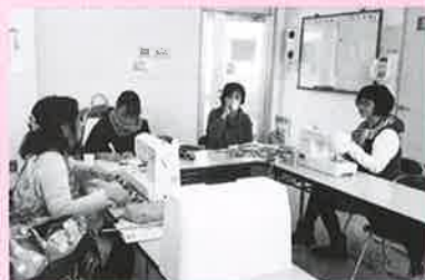
なごみカフェで子育てについて情報交換